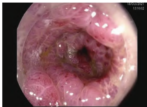
图 1 结肠镜检查示肠腔环形狭窄, 环周黏膜弥漫性充血、肿胀

患者男, 64 岁。因排便次数增多 2 个月, 加重 1 周于 2021 年 10 月 29 日入院。排不成形便每日 7~8 次, 伴便不尽感, 无便血及黏液脓血便。既往无特殊病史。直肠指诊: 距肛门约 6 cm 触及直肠管壁僵硬, 管腔狭窄, 未触及明确肿物, 退指指套无血染及脓染。肿瘤标志物: 癌胚抗原、糖类抗原 19-9 正常; 胃泌素释放肽前体 80.9 pg/ml。结肠镜检查(图 1)示距肛门约 10 cm 至肛缘见连续的环形狭窄, 环周黏膜弥漫性充血、肿胀。活检示直肠黏膜慢性炎症。全腹计算机断层扫描(computed tomography, CT)(图 2A)和直肠磁共振成像(magnetic resonance imaging, MRI)(图 2B)示直肠肠壁不规则增厚, 管腔变窄。膀胱壁不规则增厚, 向腔内凸起。双侧髂血管旁及双侧腹股沟区见多发淋巴结影。膀胱镜检查: 膀胱顶壁见多处局部黏膜隆起, 局部隆起黏膜欠光滑。取活检示上皮下结缔组织层有单排及小巢状排列的肿瘤细胞, 细胞异型